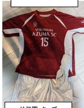
幼稚園・キッズ メインユニフォーム